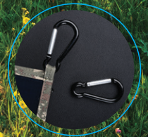
Askı Aparatı ve Kanca