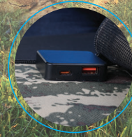
Birden fazla Cihaz Şarj Desteği

QC 3.0 teknolojisi ile 3 ampere kadar hızlı şarj desteği