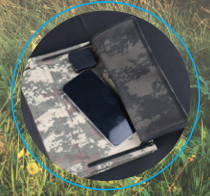
Açılabilir Fermuarlı Cep